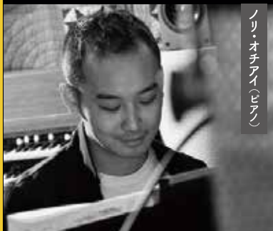
ノリ・オチアイ(ピアノ)