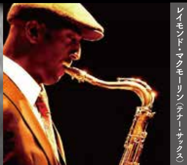
レイモンド・マクモリン(テナー・サクソ)